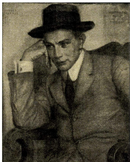
Portrait du jeune Kassner