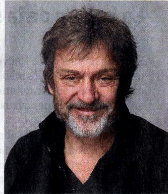
Michel Voïta.

Le lendemain, le public est invité à se retrouver dès 11 heures dans la cour du château Mercier. Pour une rencontre bilingue avec le poète allemand Jan Wagner, récipiendaire du fameux prix Georg-Büchner 2017, dont la version française des «Variations de la citerne» a fait forte impression. Jan Wagner est un poète mais aussi